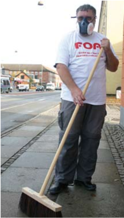
De FOA 1-medlemmer, der arbejder udendørs, burde faktisk alle sammen forsynes med åndedrætsværn ...

muner har mulighed for at indføre miljøzoner med krav om partikelfiltre på ældre lastbiler og busser med virkning fra 1. juli 2008. Med lovforslaget tager regeringen et vigtigt skridt for at nedbringe partikelforureningen i de største danske byer. Hvis der indføres miljøzoner i alle de 5 byer, der er omfattet af lovforslaget, vil omkring 1/3 af par-