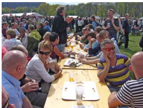
Sidste år var det strålende vejr i Fælledparken, så det håber vi også på for i år!