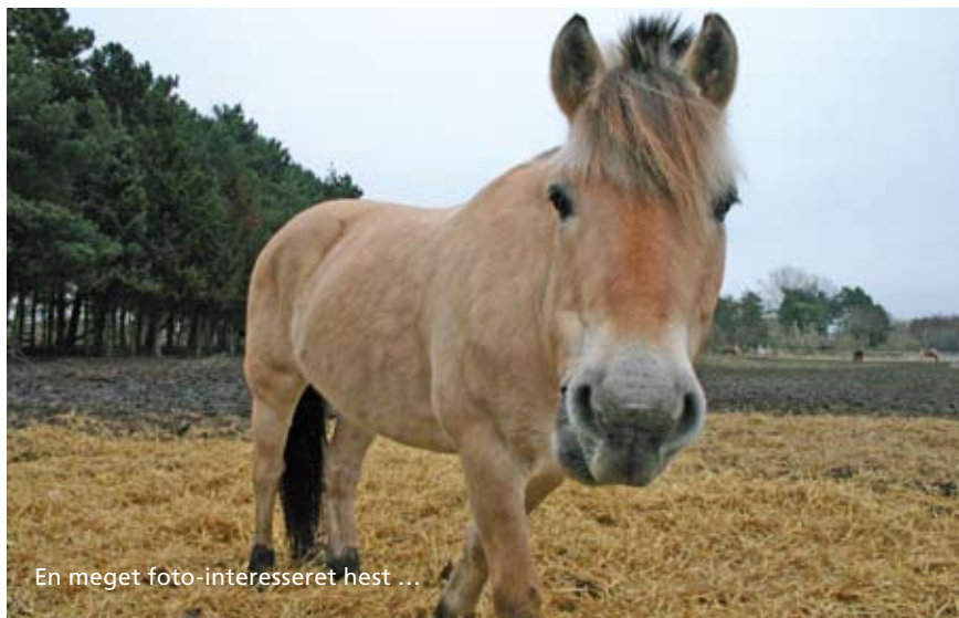
En meget foto-interesseret hest ...

2005 blev der eksempelvis afholdt danmarksmesterskaber i spring for hold og DM i handicapridning. Der er yderligere et cafeteria med tilhørende køkken med udsigt til både ridehus og springbane med plads til ca. 100 personer.