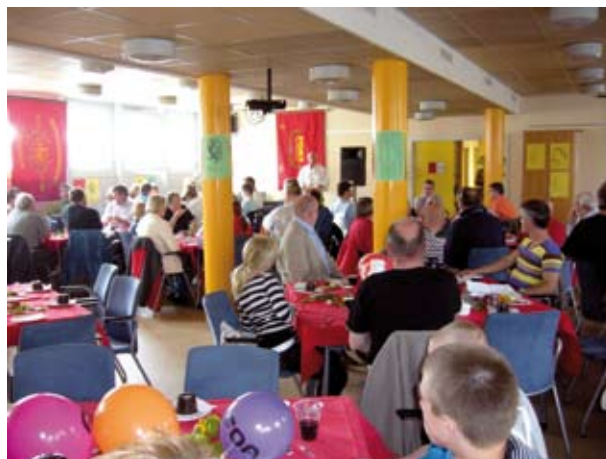
Kom til morgenbord i afdelingshuset den 1. maj

11.05: Vilhelm Thomsens Allé 9 – 11.25: Træ-Industri-Byg Afd. 27, Mølle Allé 26 - Valby Langgade - Ny Carlsbergvej - Enghavevej - Kingosgade - Alhambravej - H. C. Ørstedsgade - Griffenfeldsgade - Korsgade - Stengade - Nørrebrogade - Elmegade - Skt. Hans Torv - Nørre Allé - Borgm. Jensens Allé - Fælledparken